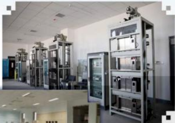
智能电梯安装调试 维护训练场所